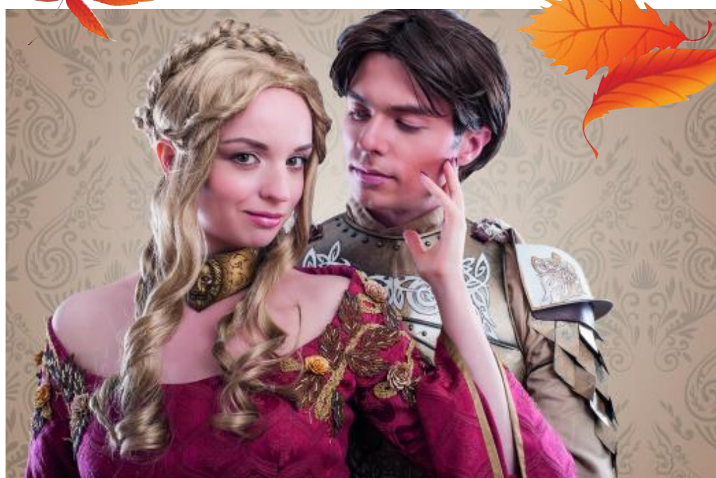
Besuchen Sie die Ausstellung mit original historischen Kostümen aus sieben Epochen – Mittelalter, Elisabethanische Mode, Barock, Rokoko, Biedermeier, Gründerjahre, Jahrhundertwende.

Langsam kündigt sich der Herbst an, doch im LuisenForum ist man schon gut auf die dritte und vierte Jahreszeit vorbereitet. Die über 50 Fachgeschäfte haben weder Kosten noch Mühen gescheut, um den Kunden die aktuellen Trends für Herbst und Winter präsentieren zu können.